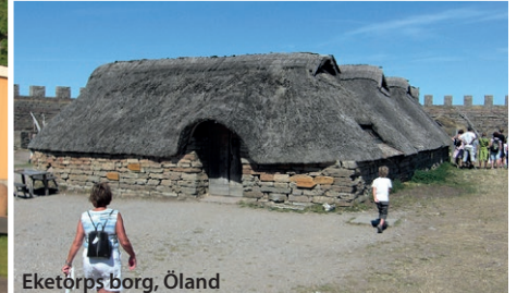
Eketörps borg, Öland