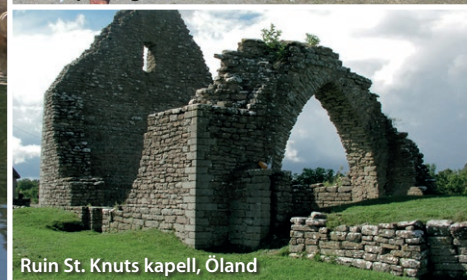
Ruin St. Knuts kapell, Öland