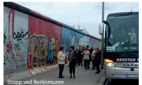
Stopp ved Berlinmuren

Avreisedato: 14.3, 11.4, 17.10 Avreisetidspunkt: Alt. 1, side 2 Prisen inkluderer: