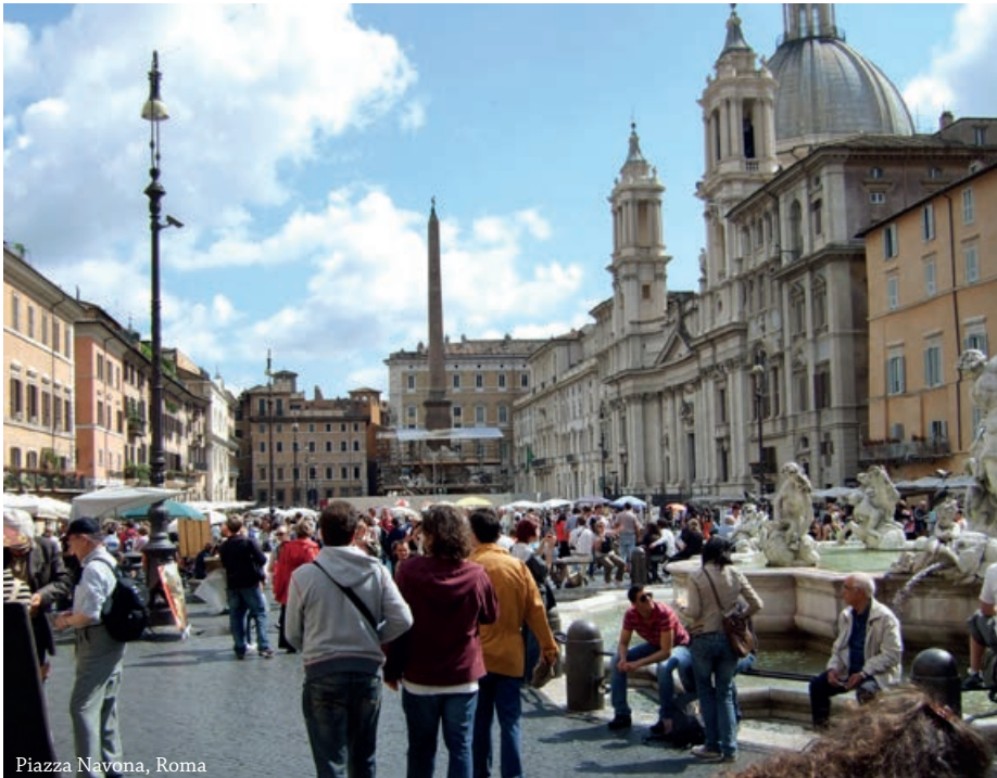
Piazza Navona, Roma

Rundreisene i Italia har vært populære i mange år. Turen foregår med fly til Roma og tilbake fra Venezia. Vi benytter egen buss på rundturen og vi besøker mange av Italias kjente byer og berømte severdigheter. Vi starter med et opphold i Roma hvor en lokal guide vil vise oss hovedseverdighetene som den imponerende Peterskirken, Forum Romanum, Colosseum, Trevifontenen og Spansketrappen ved byens forretningssentrum. Vi besøker også bydelen ved Pantheon og Piazza Navona med hyggelige uterestauranter på torvet.