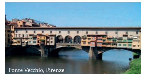
Ponte Vecchio, Firenze