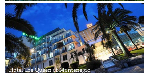
Hotel The Queen of Montenegro