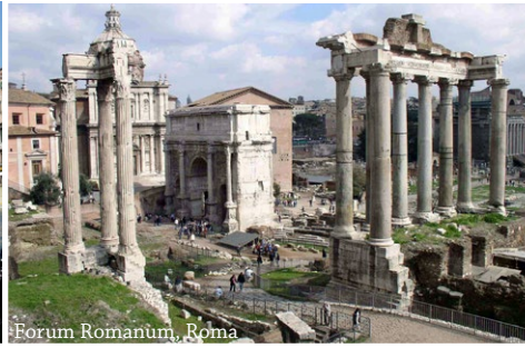
Forum Romanum, Roma