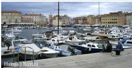
Havna i Rovinj