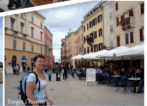
Torget i Rovinj