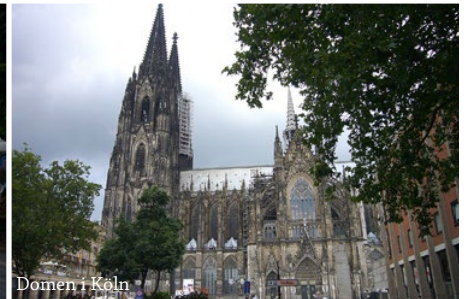
Domen i Köln

På denne turen til Paris kjører vi gjennom Moseldalen og har en overnatting i Bernkastel. Videre gjennom Luxemburg før vi ankommer Paris. Her bor vi sentralt og får tid til å oppleve denne verdensbyen. En lokal guide viser oss byens hovedseverdigheter.