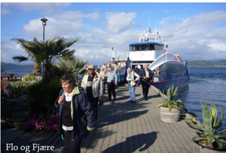
Flo og Fjære