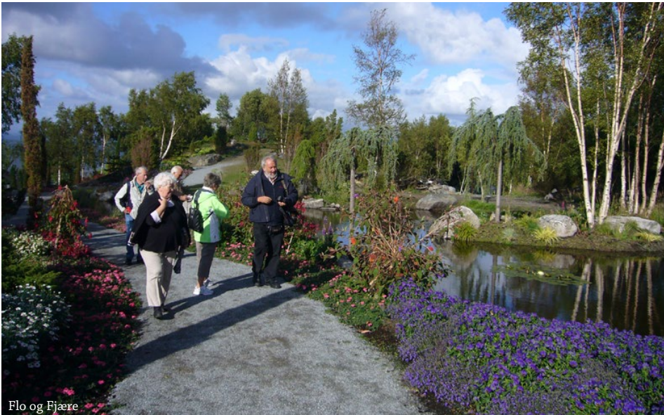
Flo og Fjære