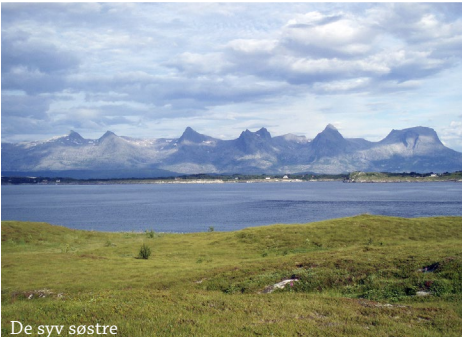
De syv søstre