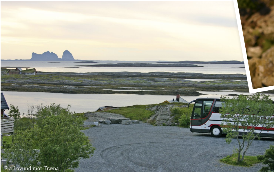
Fra Lovund mot Træna