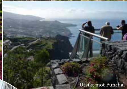
Utsikt mot Funchal