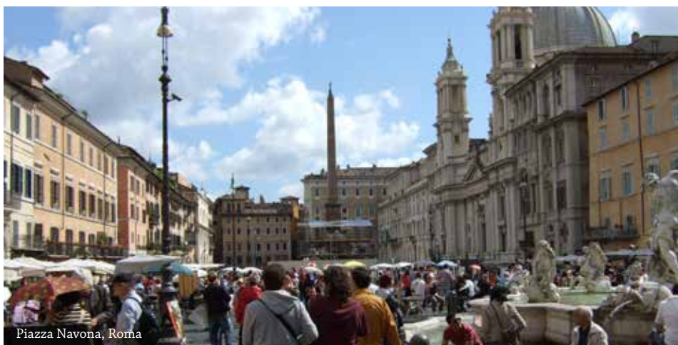
Piazza Navona, Roma