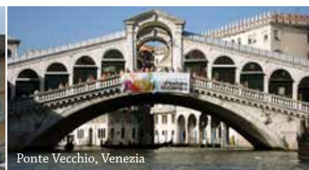
Ponte Vecchio, Venezia