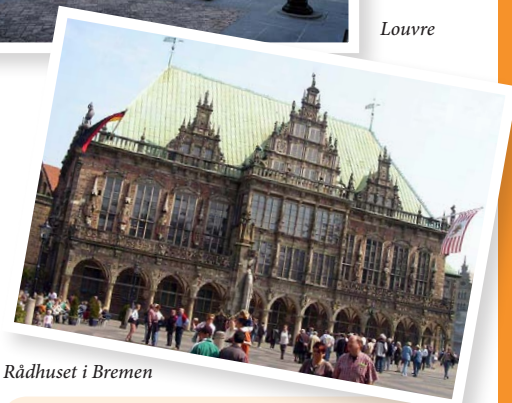
Rådhuset i Bremen