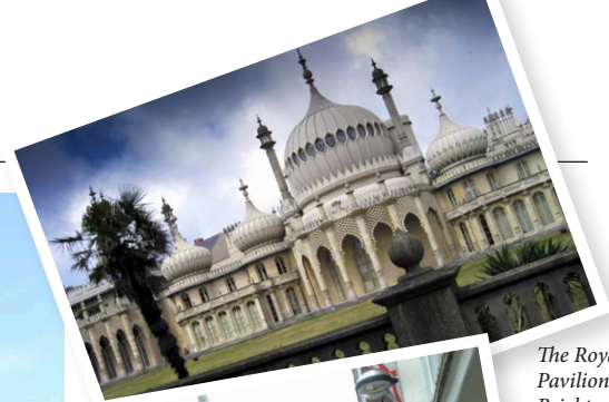
The Royal Pavilion, Brighton