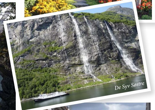
De Syv Søstre

I år har RCCL igjen avganger fra Oslo. De har ulike turer langs norskekysten. Vi har valgt en tur med Vestlandet nordover til Geiranger. På returen går ruten via Hamburg hvor det blir et opphold en dag. Det er skipet «Legend of the Seas» som benyttes. Vi kjører buss til og fra Oslo.