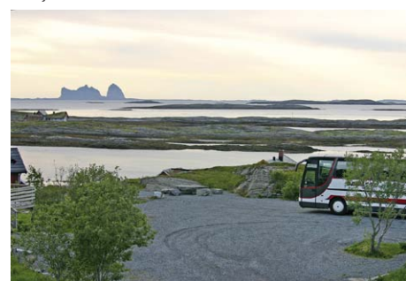
Fra Lovund mot Træna

Videre over Høylandet og frem til E6 på Grong. Vi spiser dagens middag på Snåsaheia før retur til Trøndelag på ettermiddag/kveld.