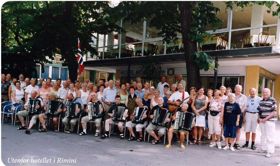
Utenfor hotellet i Rimini