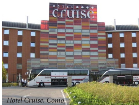
Hotel Cruise, Como

Vi kaller denne turen for «Trekkspilltur til Rimini». Den arrangeres for utøvere og andre «trekkspillfrelste». I tillegg til en ukes opphold i Rimini arrangeres utflukter til Castelfidardo med besøk på flere trekkspillfabrikker og museum. Muligheter til å overhale/repasere egne trekkspill. Vi benytter Color Line Oslo - Kiel tur/retur. Turene har blitt veldig populære siden starten i 1989. Vårturen i mai er 15 dager, mens høstturen i september er 16 dager med en ekstra dag i Rimini.