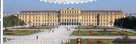
Schonbrunn Slott, Wien

Donau er den lengste elven i Europa og går fra Tyskland og frem til Svartehavet. Den går gjennom skiftende landskap, men vi har valgt den strekningen hvor vi har det flotteste landskapet kombinert med interessante plasser å besøke. På et elvecruise kan man i god tid nyte omgivelsene man "flyter" sakte forbi. God mat og underholdning ombord høres selvsagt med. I tillegg til elvecruiset inngår en interessant busstur sørover og nordover. Vi benytter Color Line Oslo - Kiel tur/retur.