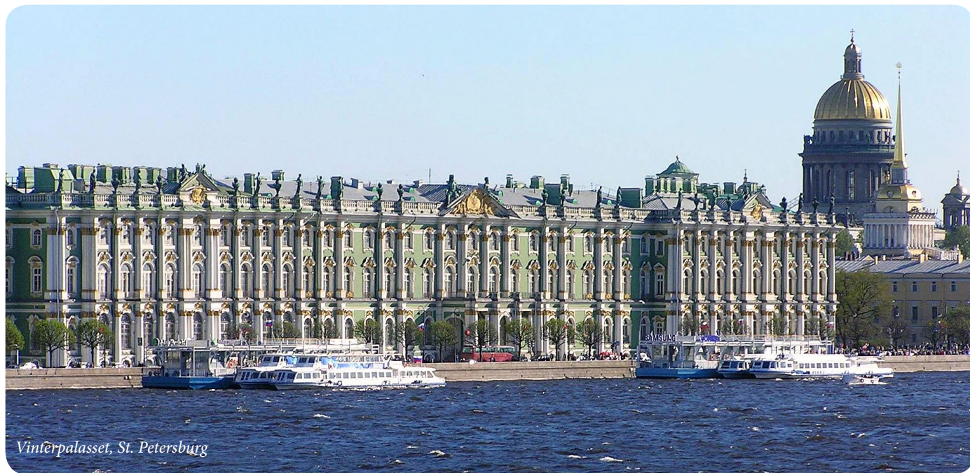
Vinterpalasset, St. Petersburg

Peter den store drømte allerede på 1700-tallet at det en dag skulle være mulig å seile mellom St.Petersburg og Moskva, men drømmen ble først virkelighet etter hans død. I dag seiler vi mellom de to metropolene, gjennom Russlands hjerte, takket være en omfattende bygging av kanaler og sluser. Med vårt flytende hotell som utgangspunkt får du oppleve byene og seilassen mellom dem, Europas to største innsjøer, Ladoga og Onega, gjennom 18 sluseanlegg og de mektige elvene Neva, Svir og Volga.