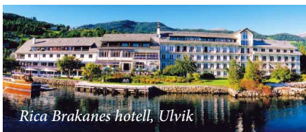
Rica Brakanes hotell, Ulvik

I områdene rundt Ulvik, innerst i Hardangerfjorden, foregår det mye fruktdyrking.