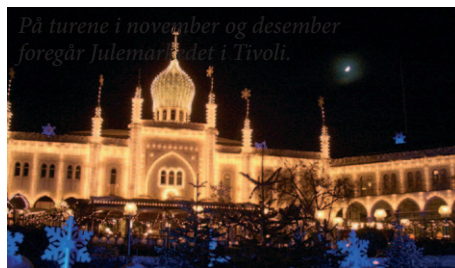
På turene i november og desember foregår Julemarkedet i Tivoli.

Kl. 09.45 legger vi til kai i Oslo igjen. Turen går nordover Østerdalen til opphold på Alvdal. Retur til Trøndelag på ettermiddagen/kvelden.