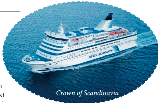
Crown of Scandinavia

Kl. 09.45 legger vi til kai i Oslo igjen. Turen går nordover Østerdalen til opphold på Alvdal. Retur til Trøndelag på ettermiddagen/kvelden.