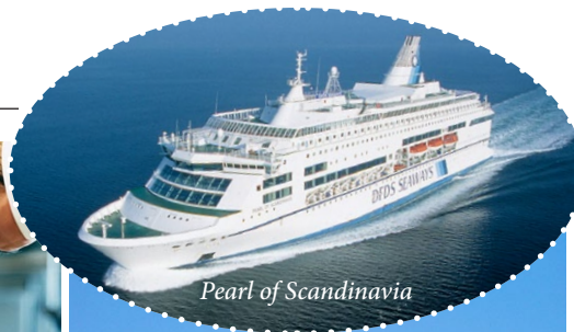
Pearl of Scandinavia