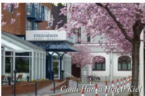
Conti Hansa Hotel, Kiel