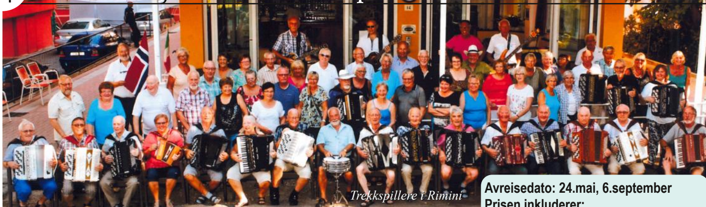
Trekkspillere i Rimini

Vi kaller denne turen for «Trekkspilltur til Rimini» Den arrangeres for utøvere og andre «trekkspillfrelste». I tillegg til en ukens opphold i Rimini arrangeres utflukter. Det inngår lunsj på 2 utflukter. Vi benytter Color Line Oslo - Kiel tur/retur. Turene har blitt veldig populære siden starten i 1989.