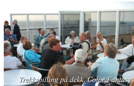
Trekkspilling på dekk, Color-Fantasy

Ankomst Oslo kl.10.00. Turen går nordover Gudbrandsdalen eller Østerdalen med stopp på Dombås eller Alvdal. Retur til Trøndelag på kvelden.