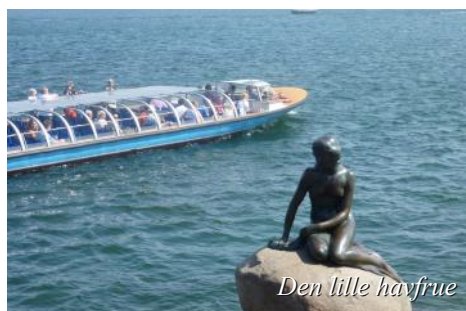
Den lille havfrue