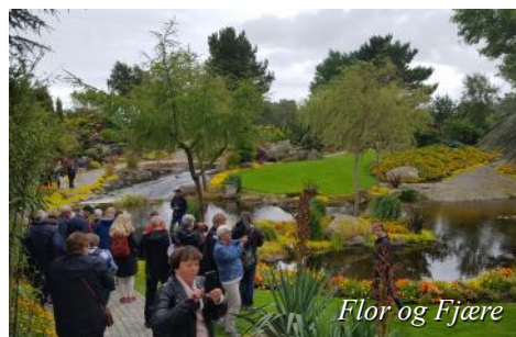
Flor og Fjære

Fortsetter til Haukeligrend og langs Totakvannet til Rauland. Videre til Mosvatn og frem til Vemork. Her besøkes Norsk