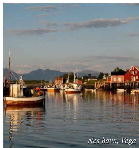
Nes havn, Vega