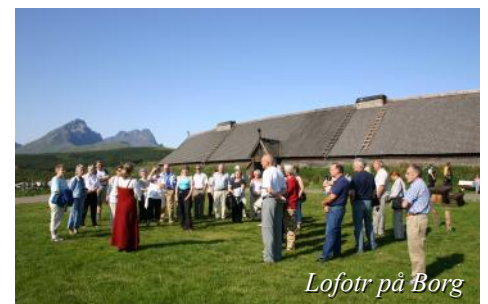
Lofotr på Borg