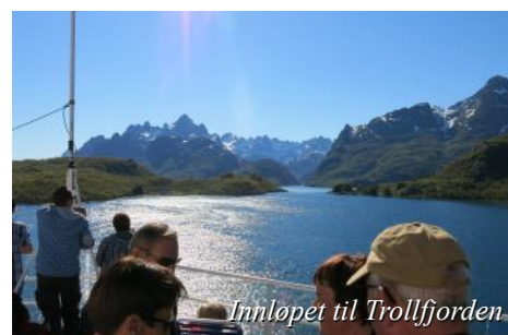
Innl petet til Trollfjorden