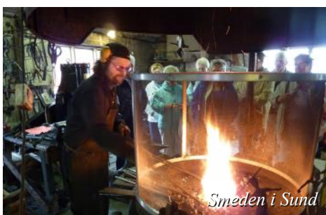
Smeden i Sund