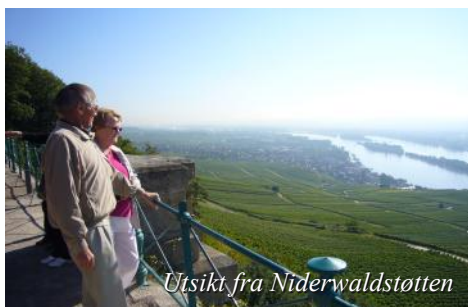
Utsikt fra Niderwaldstøtten

Frokost ombord før ankomst Oslo kl. 10.00. Turen går nordover Gudbrandsdalen og turens siste middag inntas på Dombås. Retur til Trøndelag på kvelden.