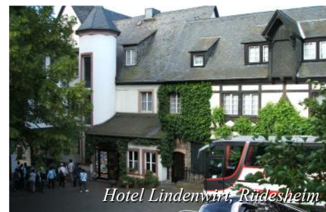
Hotel Lindewirt, Rudesheim