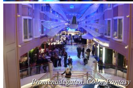
Promenadegaten, Color Fantasy