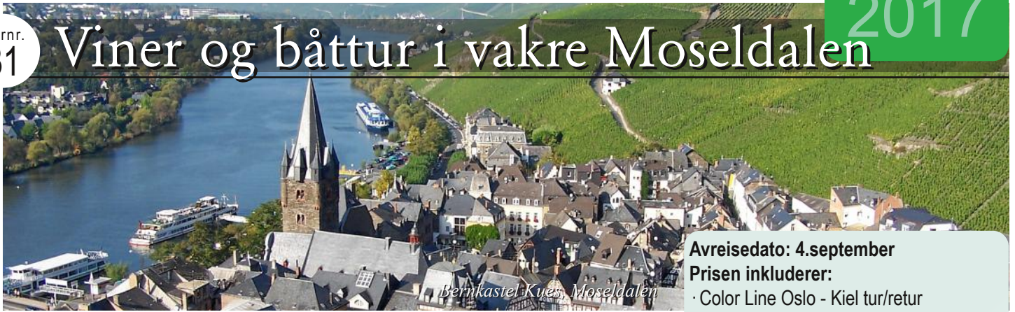
Bernkastel Kues, Moseldalen