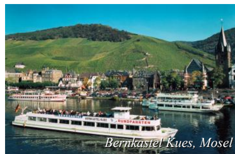
Bernkastel Kues, Mosel