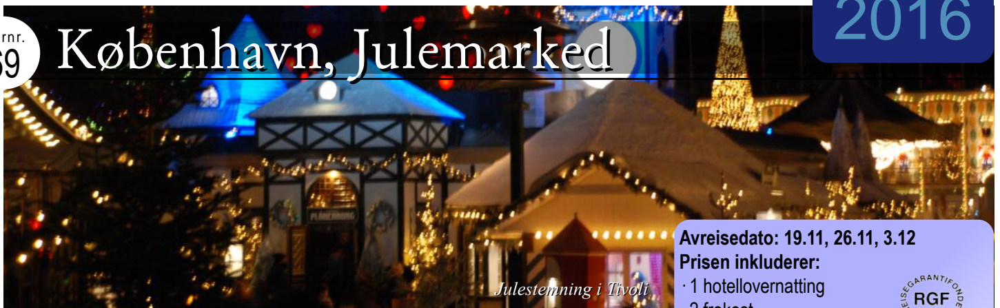
Julestemning i Tivoli

Fra midten av november åpner det stor julemarkedet i Tivoli. Disse 4-dagers turene i november og desember har blitt svært populære. Vi har to fine nattseilinger med DFDS's store ferje «Crown Seaways» eller «Pearl Seaways» mellom Oslo og København tur/retur. Vi har to hele dager disponible i København eller nærliggende områder. Dette gir tid til handling eller andre opplevelser København har å by på. Overnatting i København på sentralt hotell.