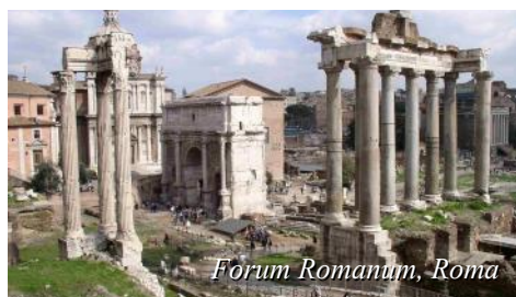
Forum Romanum, Roma