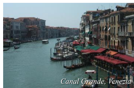
Canal Grande, Venezia