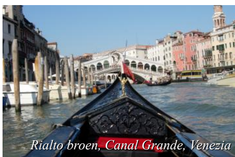
Rialto broen, Canal Grande, Venezia