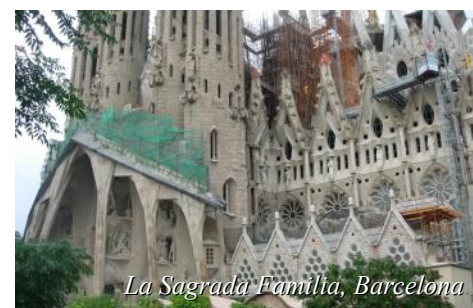
La Sagrada Família, Barcelona