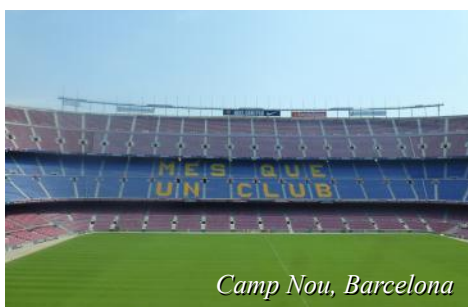
Camp Nou, Barcelona