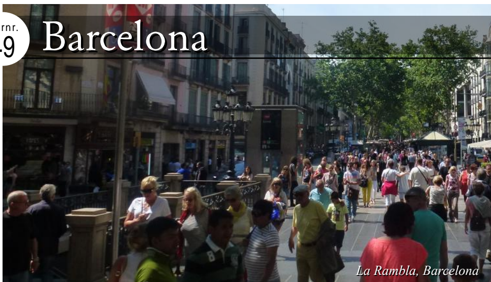
La Rambla, Barcelona