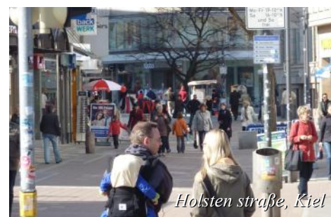
Holsten strasse, Kiel