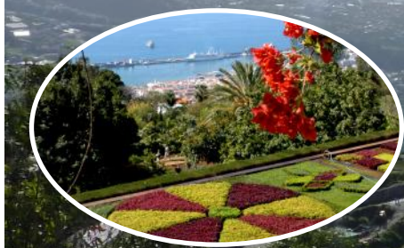
fra utsiktspunktet Cabo Girão, mot Funchal

Det er lett å forstå hvorfor Madeira blir beskrevet som en flytende blomsterbukett, det er grønt overalt og det er en rik blomsterprakt og høye majestetiske fjell. Øya har et mildt klima i Atlanterhavet vest for Portugal og nord for Kanariøyene. Madeira er ikke bare storslagen natur og overdådig blomsterprakt. Øyas velkjente gjestfrihet har lange tradisjoner og service har blitt et av Madeiras varemerker. Vi benytter direktefly fra Værnes til Madeira tur/retur.