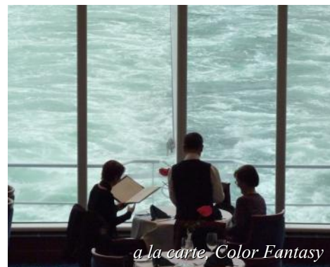
a la carte, Color Fantasy