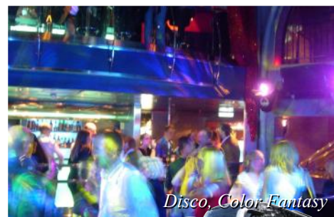
Disco, Color Fantasy