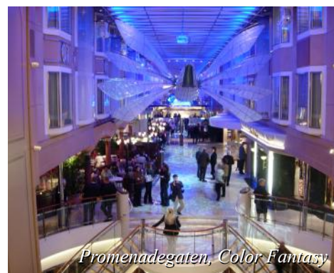
Promenadegaten, Color Fantasy