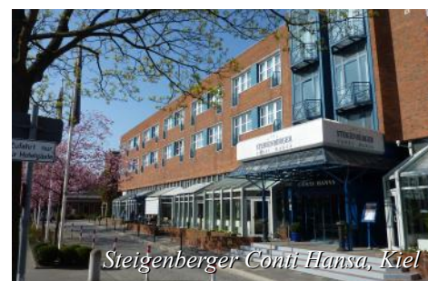
Steigenberger Conti Hansa, Kiel