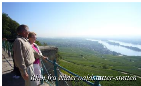
Rhin fra Niederwaldstatter-stöten