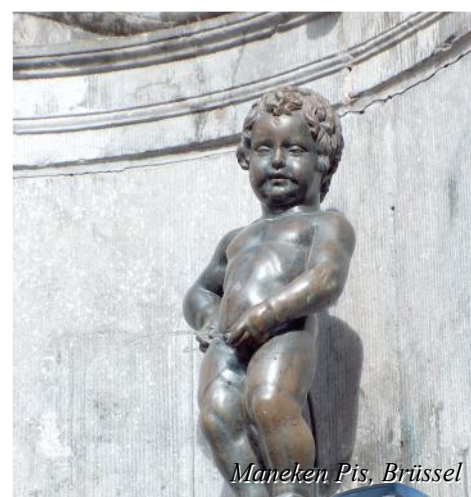
Maneken Pis, Brussel