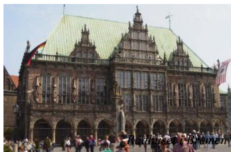
Rådhuset i Bremen

Vi kjører nordover forbi Hamburg, Lübeck og til Puttgarden, med ferje til