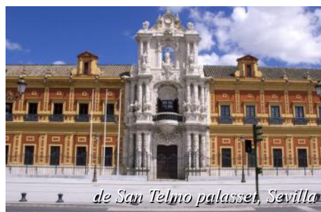
de San Telmo palasset, Sevilla