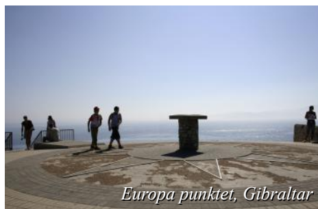
Europa punkt, Gibraltar

På formiddagen kjører vi sørover forbi Jerez og østover frem til Gibraltar. På ettermiddagen tar vi et opphold i Gibraltar som har tilhørt England siden 1713. Gibraltar har idag ca 25.000 innbyggere. Byen ligger på sørvestsiden av den karakteristiske klippen som rager 400 m.o.h. Vi tar en