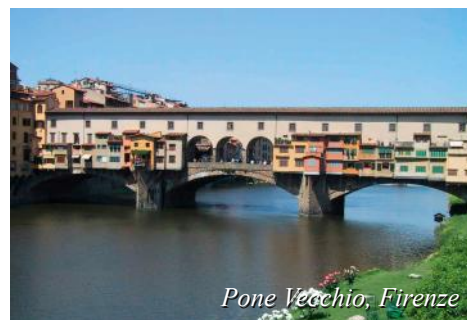
Ponte Vecchio, Firenze