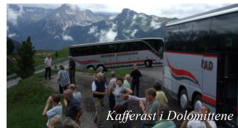
Kafferast i Dolomittene

Frokost på ferja før ankomst Oslo på morgenen kl. 09.45. Turens siste middag inntas på Frichs Kafeteria, Dombås. Retur til Trøndelag på sen ettermiddag/kveld.