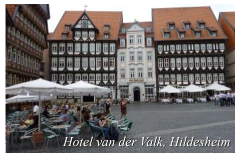
Hotel van der Valk, Hildesheim