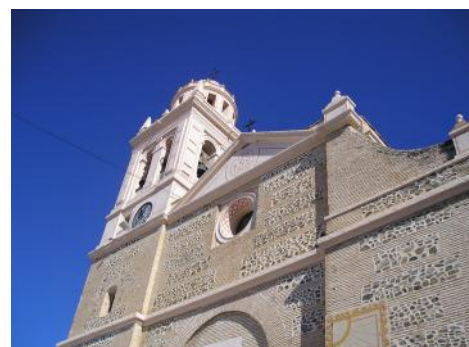
Kirke i Almunecar