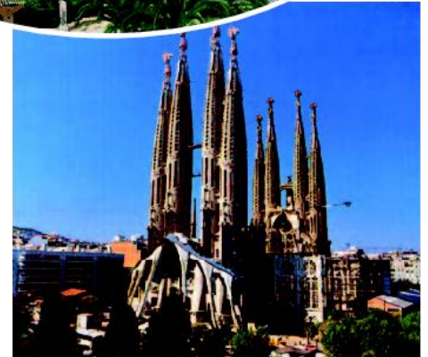
La Sagrada Familia, Barcelona