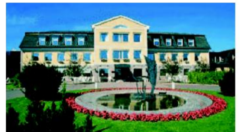
Hotel Selma Lagerlöf