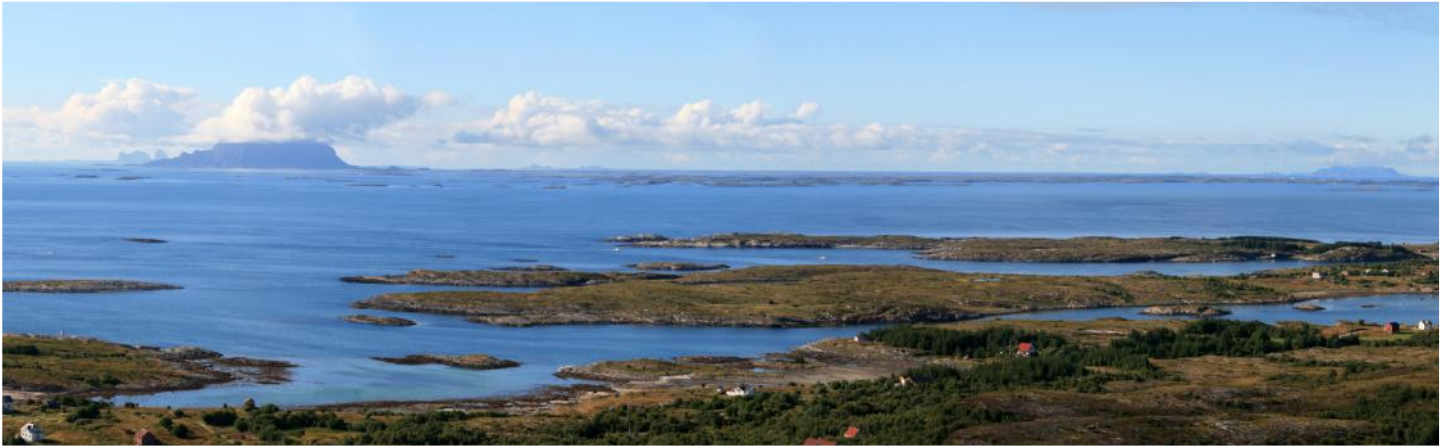
Helgeland, tatt fra Dønnesfjellet

Denne turen går kystriksvegen langs Helgelandskysten med skiftende kystlandskap med høye fjell og fruktbare sletter ut mot havet. Men vi forlater hovedvegen og besøker øyene Dønna, Lovund og Træna ytterst på Helgelandskysten med små levende kystsamfunn på øyer med høye fjell. På Lovund har en av Norges største lundefuglkolonier sitt tilholdssted.