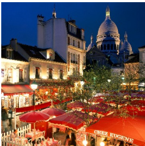
Malernes Torg, Paris