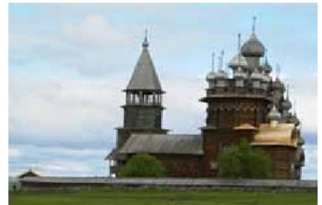
Kristi Forklarelseskirke, Kizji

Peter den store drømte allerede på 1700-tallet at det en dag skulle være mulig å seile mellom St.Petersburg og Moskva, men drømmen ble først virkelighet etter hans død. I dag seiler vi mellom de to metropolene, gjennom Russlands hjerte, takket være en omfattende bygging av kanaler og sluser. Med vårt flytende hotell som utgangspunkt får du oppleve byene og seilassen mellom dem, Europas to største innsjøer, Ladoga og Onega, gjennom 18 sluseanlegg og de mektige elvene Neva, Svir og Volga. .