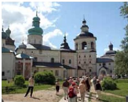
Kirillo-Belozersky klosteret, Goritsy