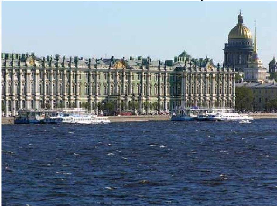
Vinterpalasset, St. Petersburg