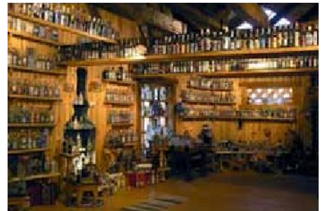
Vodkamuset i Mandrogi