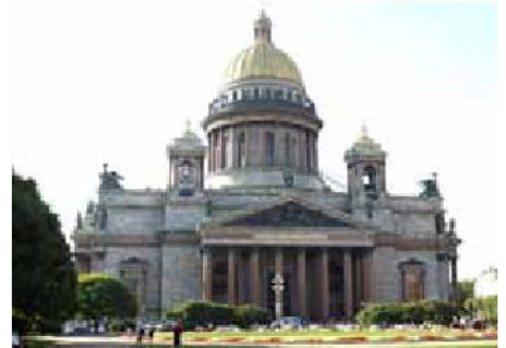
St. Isak katedralen, St. Petersburg