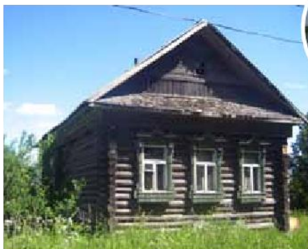
Izba, russisk bondehus