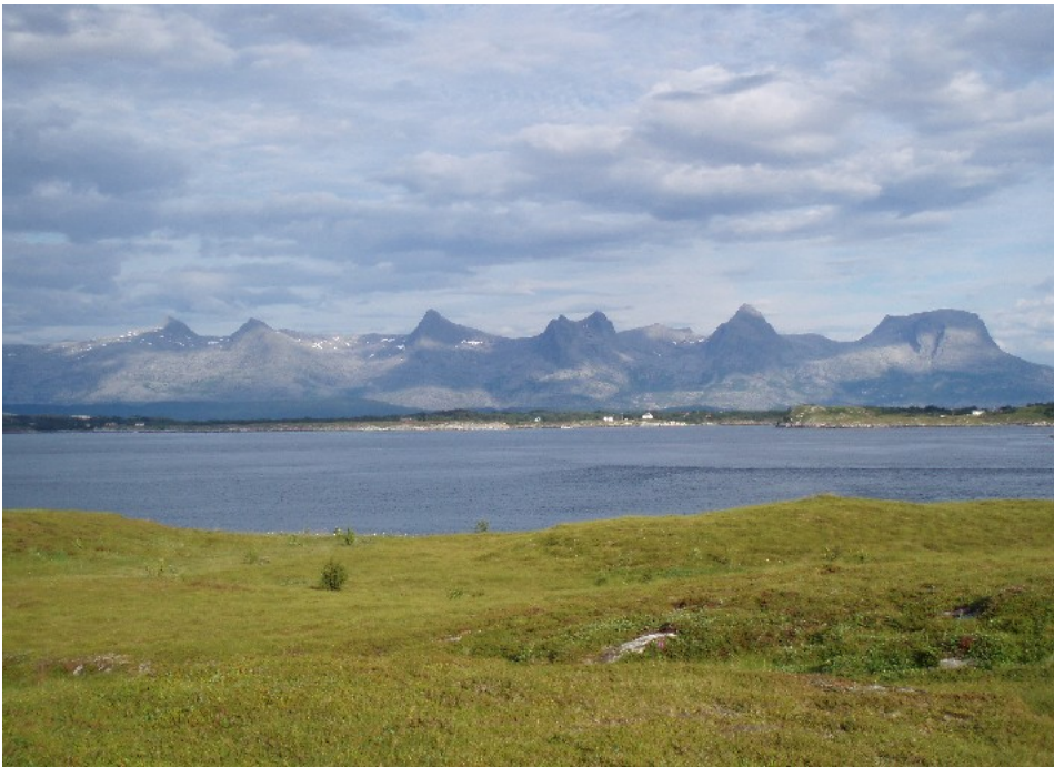
de Syv Søstre, ved Sandnessjøen