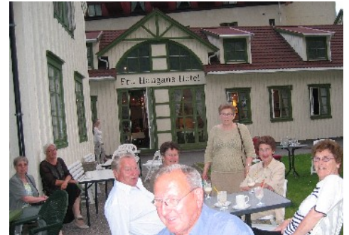
Fru Haugans Hotell, Mosjøen