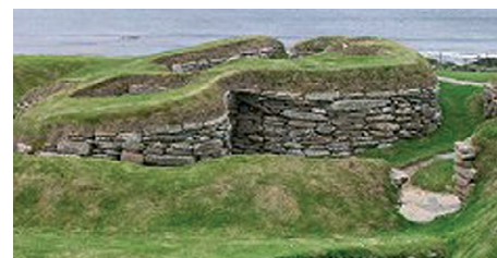
Skara Brae, Orknøyene

over mot Newcastle. Kl.15.00 avreise med DFDS's ferje til Bergen. Middag ombord og overnatting i utvendige lugarer.