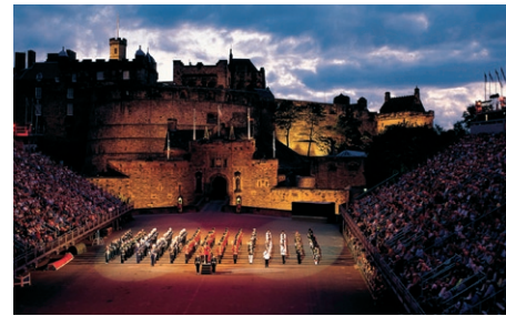
Military Tatro, Edinburgh

På formiddagen kjører vi langs kysten sør-