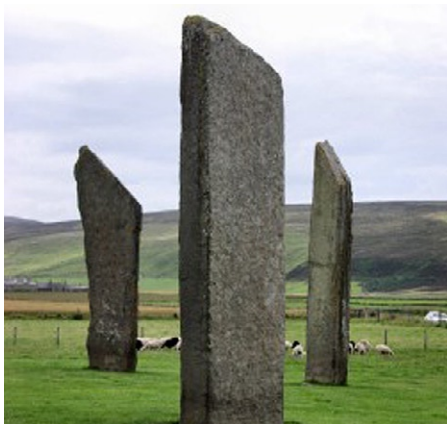
Standing Stones, Orknøyene